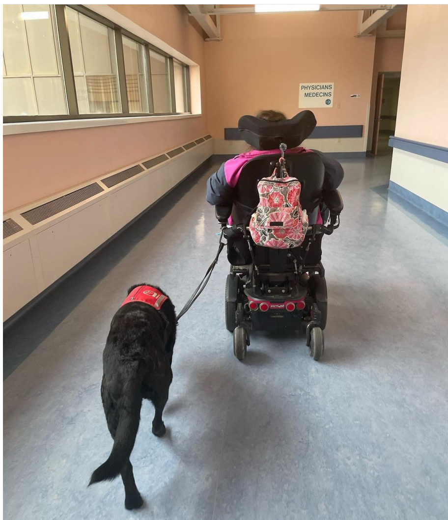
Stacey et Jade, Équipe de Chiens-Guides de Service @stacey_and_jade2017